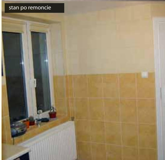
stan po remoncie

W przypadku Ali pracownik socjalny stwierdził, że stan mieszkania uniemożliwia powrót dziewczynki do domu – wcześniejszy pożar i zalanie ogromnymi ilościami wody przez straż pożarną, a następnie we własnym zakresie przeprowadzony remont, spowodowały ogromne zagrzybienie pomieszczeń mieszkalnych. Przed powrotem dziecka do domu należało odgrzybić mieszkanie oraz wykonać wiele rozległych prac remontowo-adaptacyjnych i wymienić meble.