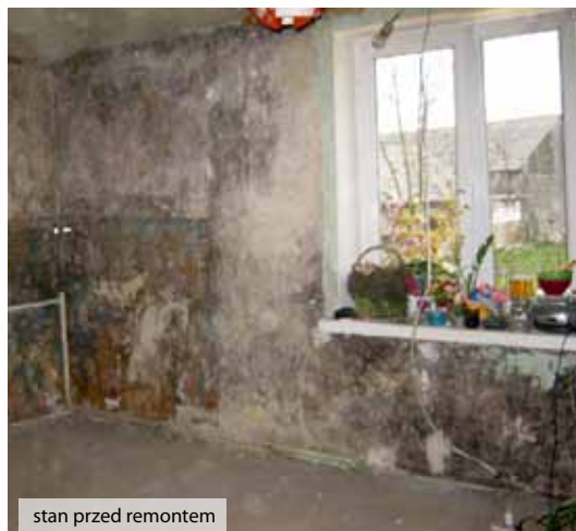
stan przed remontem

Aby dziecko mogło wrócić ze szpitala do domu, należy zapewnić mu odpowiednie warunki mieszkaniowe. Istotne jest, aby pomieszczenia w których będzie przebywało, nie stanowiły dodatkowego zagrożenia dla jego zdrowia. Przed przyjęciem dziecka pod opiekę Warszawskiego Hospicjum dla Dzieci do jego domu kierowany jest pracownik socjalny, którego zadaniem jest ocena warunków mieszkaniowych rodziny.