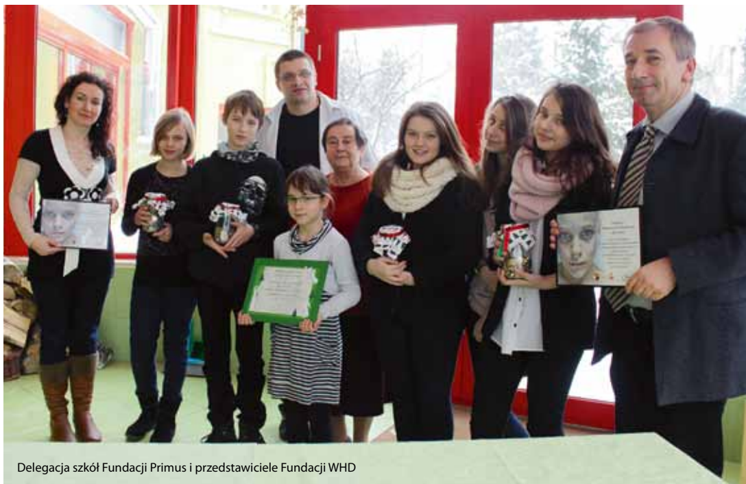
Delegacja szkół Fundacji Primus i przedstawiciele Fundacji WHD

Gimnazjaliści zbierają pieniądze, by przekazać je na potrzeby pacjentów Warszawskiego Hospicjum dla Dzieci