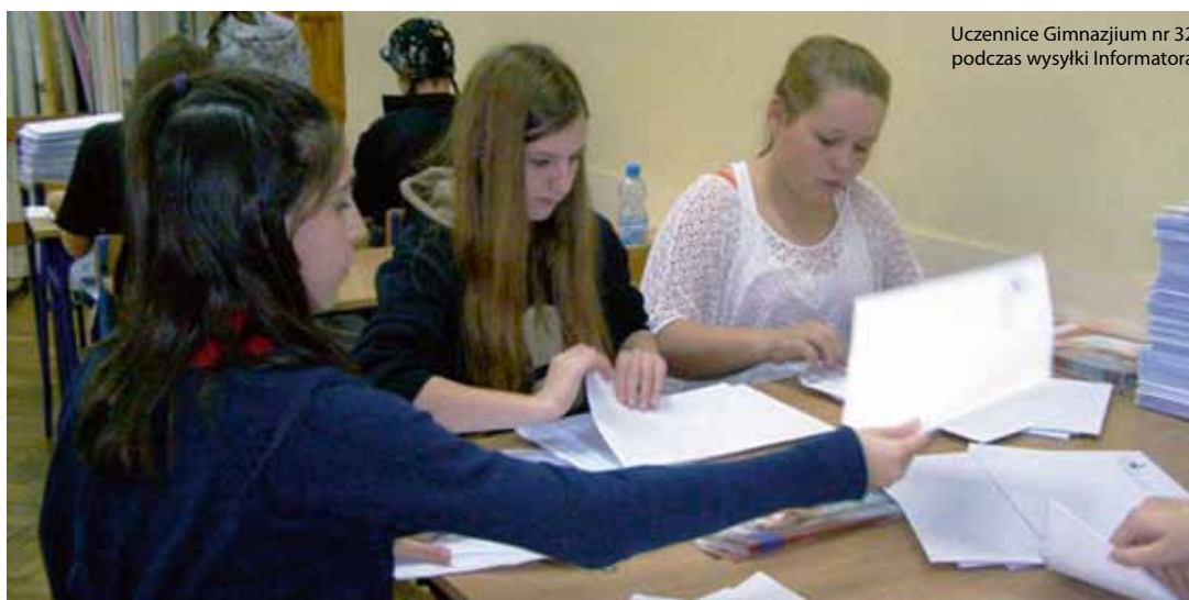
Uczennice Gimnazjum nr 32 podczas wysyłki Informatora

Szczególnie w dzisiejszych czasach wolontariat powinien stać się ważnym narzędziem w wychowaniu młodzieży