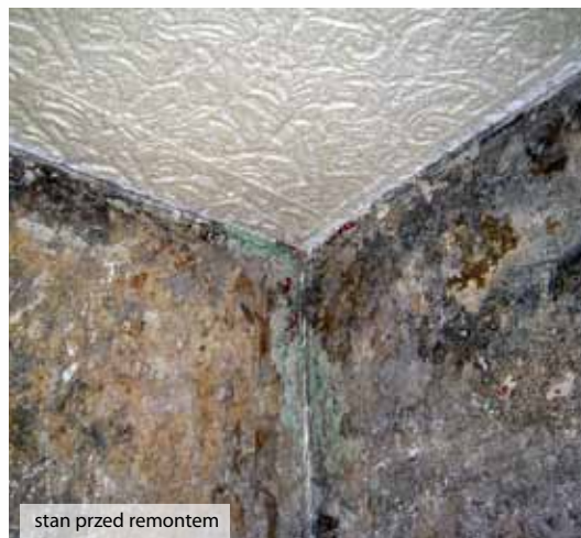
stan przed remontem

Grzyby pleśniowe bardzo często występują w otoczeniu człowieka. W środowisku wilgotnym pleśnie mogą rozwijać się na większości substancji organicznych. Zmieniają i rozkładają substancje organiczne poprzez wytwarzanie enzymów. Mogą też od podstaw tworzyć nowe złożone substancje chemiczne, które człowiek potrafi wykorzystać