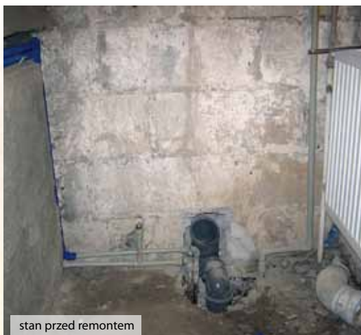
stan przed remontem