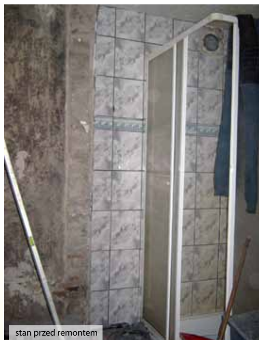
stan przed remoncie