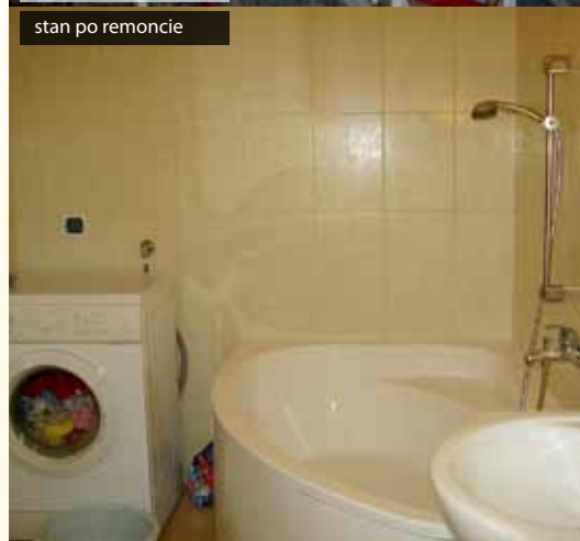
stan po remoncie