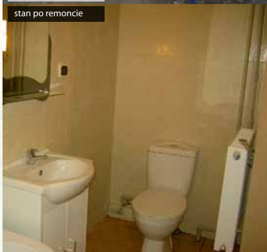
stan po remoncie

Dodatkowo pracownicy Fundacji WHD zalecają rodzinom: