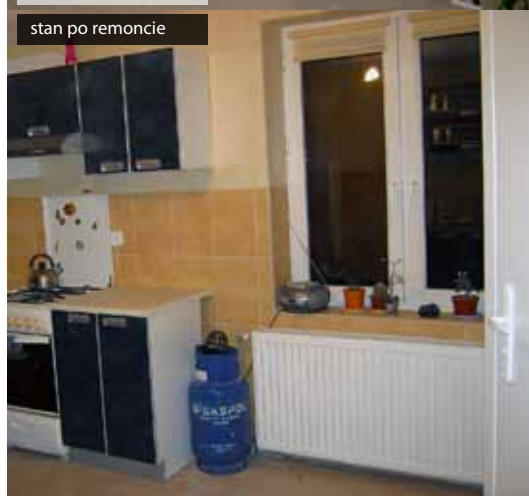
stan po remoncie