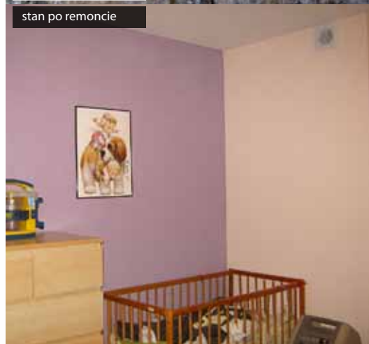
stan po remoncie

do własnych celów. Biotechnologia wykorzystuje te możliwości w zakresie produkcji środków spożywczych (sery pleśniowe President, Valbon, Napoleon, Geramont), antybiotyków (Penicyllina, Ospen, Augmentin, Duomox, Hiconcil, Pipril, Carbenicylina, Sefril, Duracef, Biotraxon, Tarcefoksym, Zinacef), czy innych leków (Vit B2, \beta -karoten, Ergotamina, Gryseofulwina, Cyklosporyna, Lowastatyna)