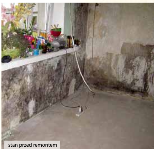
stan przed remontem